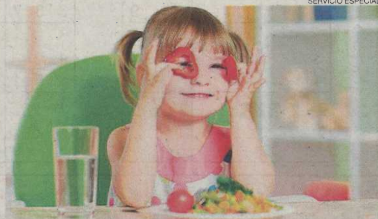
Una niña utiliza el pimienta a modo de gafas.

En la sesión se abordarán cuestiones relacionadas con el consumo o no de determinados alimentos. Como punto de partida, la terapeuta