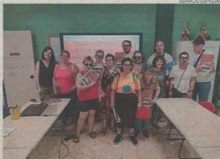
La comisión Creando Espacios Accesibles valida las noticias de 'Te lo contamos fácil'.

Según la Organización Mundial de la Salud, una de cada